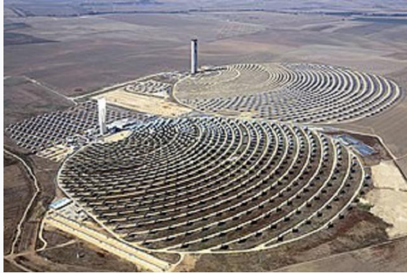
Διατάξεις εκμετάλλευσης της ηλιακής ενέργειας.

Στο Άρθρο 2 της Συνθήκης του Άμστερνταμ (1997) γίνεται λόγος για «αρμονική ισορροπο και αειφόρο ανάπτυξη των οικονομικών δραστηριοτήτων» (European Communities, 1999). Έτσι η βιώσιμη ανάπτυξη έπαψε να θεωρείται αποκλειστικά περιβαλλοντική έννοια και αναγνωρίστηκε πως πρέπει να υπάρξει στενή συσχέτιση ανάμεσα στην οικονομική ανάπτυξη, στην κοινωνική συνοχή και στην περιβαλλοντική προστασία στα πλαίσια της στρατηγικής της ΕΕ για τη βιώσιμη ανάπτυξη (Commission of the European Communities, 2001). Από την πλευρά των οικονομικών του περιβάλλοντος, το περιβάλλον και οι φυσικοί πόροι τους οποίους αυτό περιλαμβάνει μπορεί να θεωρηθούν ως απόθεμα φυσικού κεφαλαίου. Το απόθεμα αυτό μπορεί να χρησιμοποιηθεί και να αποσπασθεί.